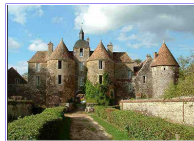
Château de Ratilly à Treigny

Date limite d'inscription : Le vendredi 10 mai 2019 et dans la limite des places disponibles